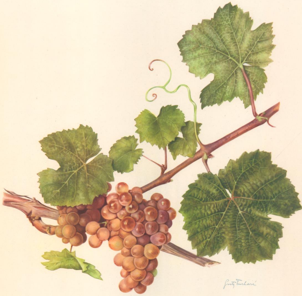
Traminer aromatique rouge . Traminer gewürzter roter . Traminac mirisavi crveni . Traminer aromatico rosso . Traminer aromatic red