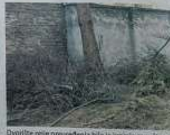
Dvoilike prije preuređenja bile je krajnje zapušteno

Sve što vidite napravljeno je rukama. Ovdje su samo panjevi, grančice, letvice... Ako sada odemo, priroda će sve to jednog dana pojesti, i za nas neće ostati nikakvo smeće.